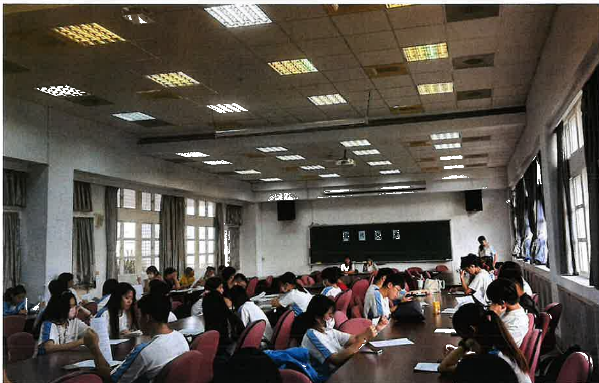
照片說明:班代認真聆聽會議