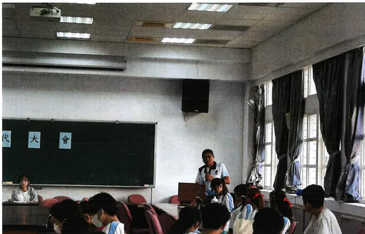
照片說明:學務主任補充說明案由二細項