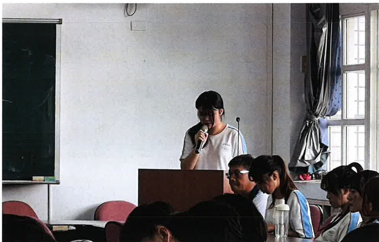
照片說明:學生會幹部擔任司儀