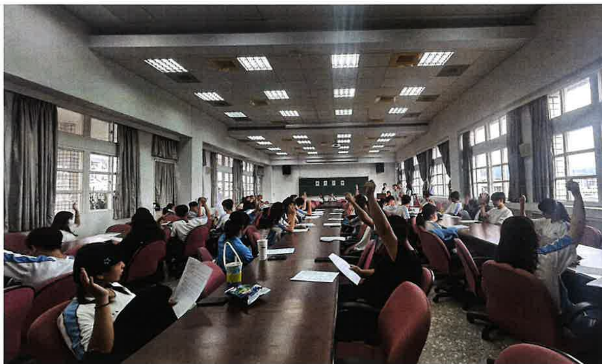
照片說明:班代進行申評會學生代表投票